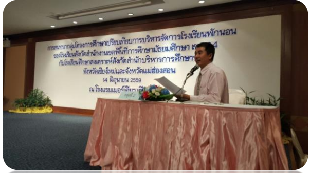
ภาคผนวก ข ภาพประกอบ